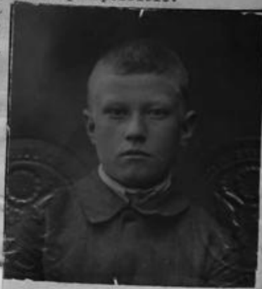
Best Available Image

Applicant has apply for a Dep. -1917 [His] Mar. apply to the A for myself, a solemnly swear the 3 I do not is now dec the purpose of I am domiciled New York day I am the bear of December purpose of resid States passp I desire a passp Fra Eng Further, I do nize, foreign an y, without any rican Embes Sworn to befo [SEAL] * A person born if possible. If the applican It is desirable, See circular in C. 11